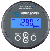
Bluetooth tespiti BMV-712 Smart Akü Monitörü