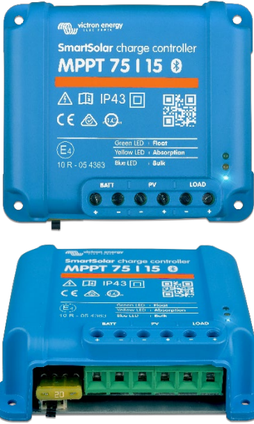
SmartSolar Şarj Kontrol Birimi MPPT 75/15