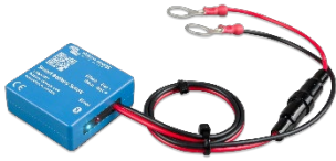
Bluetooth tespiti Akıllı Akü Hassasiyeti